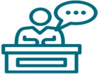
卑詩人權講習所 (及其他人士)