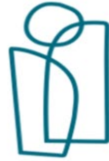
卑詩人權專員 辦公室