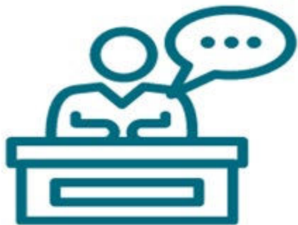
卑詩人權講習所 (及其他人士)