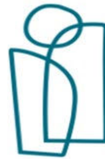
卑詩人權專員 辦公室